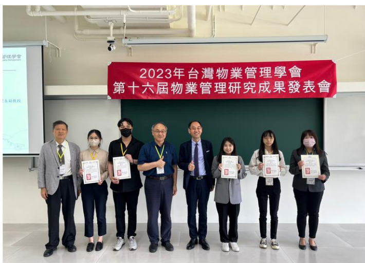
5名佳作論文得獎者