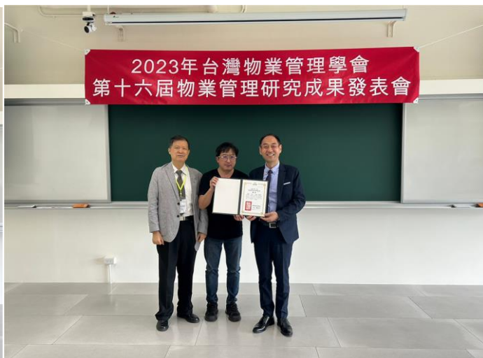
第一名 優良論文得獎者