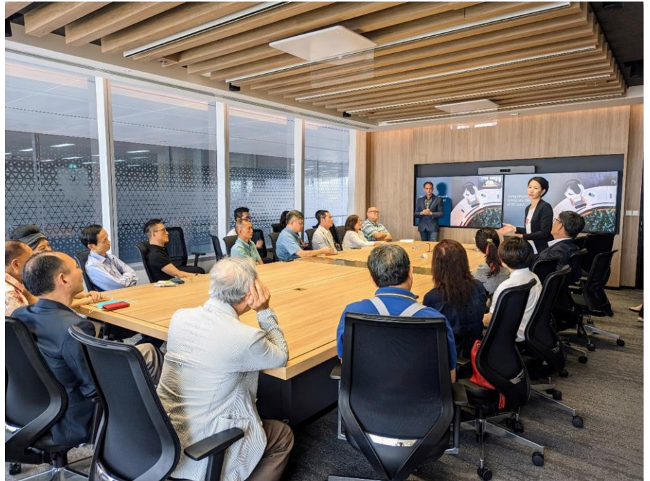
於 JLL 泰國曼谷總部現場簡報

另外，我們還有機會拜會了大使館，並能與莊大使交流座談。大使館是促進國際合作和交流的關鍵，在引進外國投資和促