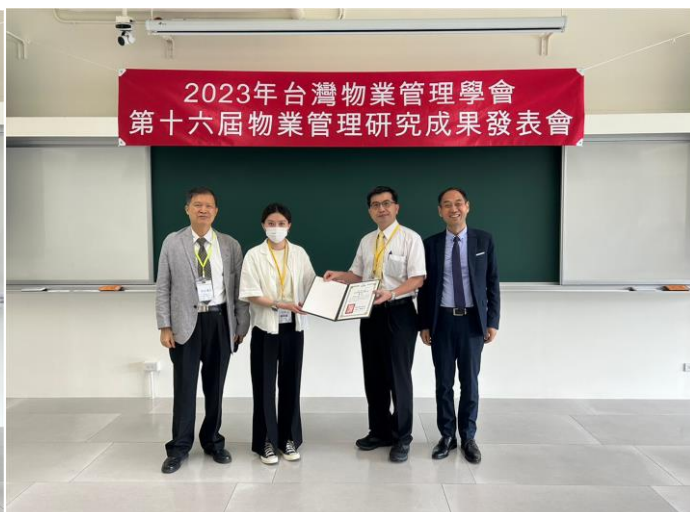
第三名 優良論文得獎者