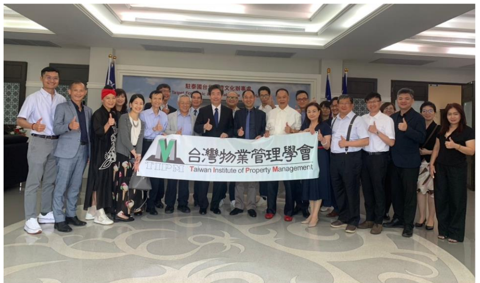
於駐泰國使館拜會莊大使

進國際貿易方面發揮著重要作用。這次與大使的暢談讓我明白到，作為一個物業管理者，我們需要關注全球市場和國際化趨勢，並主動尋求國際合作的機會。